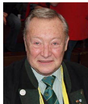
Der Präsident des Deutschen Schützenbundes Josef Ambacher. Die Bundesligafinals in Coburg wollte auch er keinesfalls verpassen.