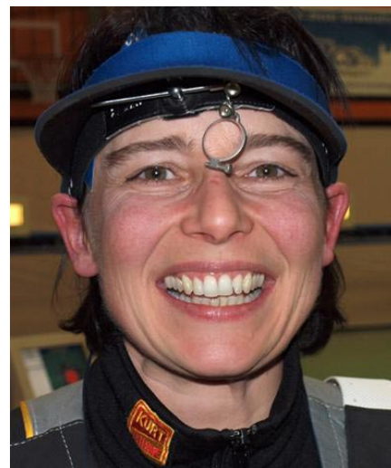
Kann sich immer noch riesig freuen, wenn sie solch ein Top-Ergebnis geschossen hat.

Bei den Luftpistolenschützen, deren Wettbewerbe zeitgleich neben den Gewehrschützen abliefen, standen sich der TSV Ötlingen und die SG Waldenburg im Finale gegenüber. Waldenburg sicherte sich mit 3:2 Punkten zum vierten Mal den Titel des Deutschen Mannschaftsmeisters Luftpistole. Dritter wurde der SV Kelheim-Gmünd, der sich mit 3:2 gegen Bremen-Bassum durchsetzen konnte.